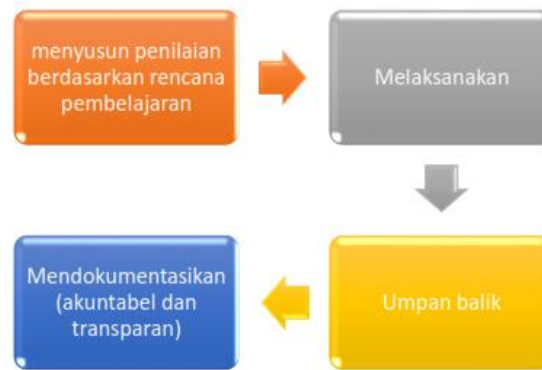
Gambar 1. Mekanisme Pelaksanaan Penilaian

Mekanisme penilaian terdiri dari beberapa tahapan: perencanaan, pelaksanaan, pemberian umpan balik, dan pendokumentasian seperti pada Gambar 1. berikut: